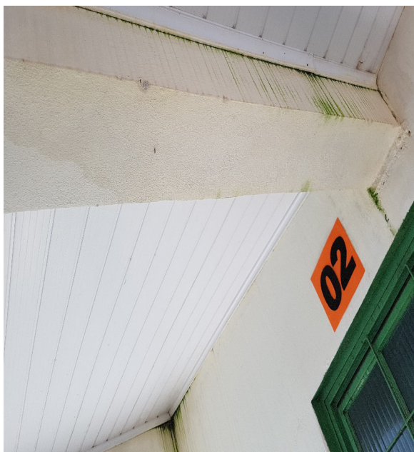
Infiltrações e vazamento das calhas