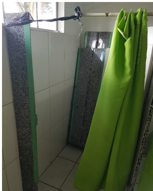
“Improvise” para as portas dos banheiros, encostadas no fundo de um dos boxes.